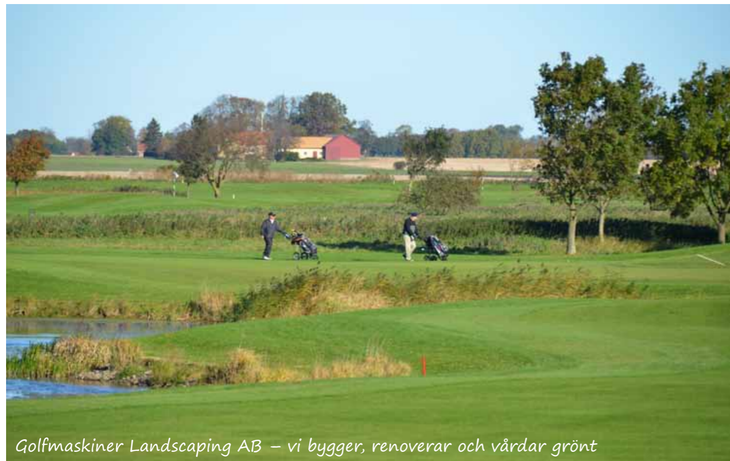
Golfmaskiner Landscaping AB – vi bygger, renoverar och vårdar grönt

Vårt system är ett totalt skötselkoncept med ambitionen att skapa perfekta, professionella spelytor. Vi erbjuder dig produkter och lösningar anpassat efter dina behov och har såväl enskilda tjänster som specialanpassade totallösningar, tillsammans ett överlägset alternativ när det gäller allt som är viktigt inom krävande landscaping riktad mot golfbanor.