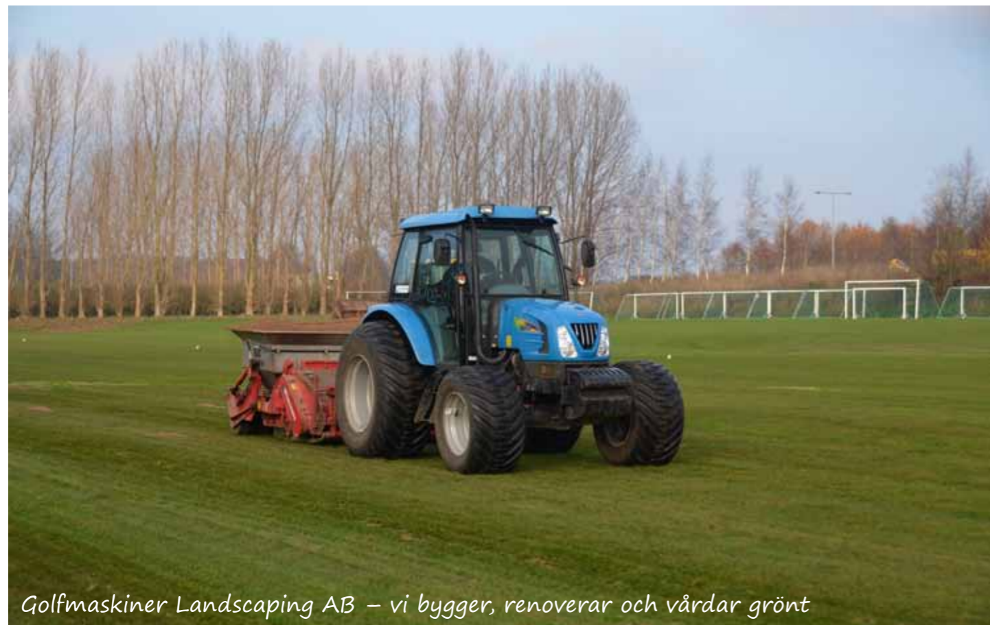
Golfmaskiner Landscaping AB – vi bygger, renoverar och vårdar grönt

Vårt system är ett totalt skötselkoncept med ambitionen att skapa perfekta, professionella gräsytor. Vi erbjuder dig produkter och lösningar anpassat efter dina behov och har såväl enskilda tjänster som specialanpassade totallösningar, tillsammans ett överlägset alternativ när det gäller allt som är viktigt inom krävande landscaping riktad mot idrottsplaner och sportfält.